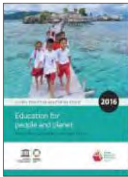
Education for People and Planet: Creating sustainable futures for all Global Education Monitoring Report 2016

The report highlights the ways in which education can serve as a catalyst for the overall 2030 agenda for sustainable development. It also tackles the many challenges of monitoring progress towards the Sustainable Development Goal 4, including recommendations for policy change at the national, regional and global level.