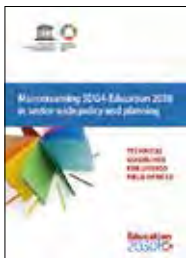
Mainstreaming SDG4-Education 2030 in sector-wide policy and planning Technical guidelines for UNESCO field offices 2016

The report examines accountability in education, analyzing how all relevant stakeholders can provide education more effectively, efficiently and equitably. It looks into accountability mechanisms that are used to hold governments, schools, teachers, parents, the international community, and the private sector accountable for inclusive, equitable and quality education. By analyzing which policies make accountability work or fail, and which external factors impact on their success, it concludes with concrete recommendations to help build stronger education systems