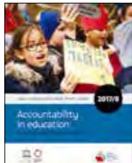
Accountability in Education: Meeting our commitments Global Education Monitoring Report 2017

The report highlights the ways in which education can serve as a catalyst for the overall 2030 agenda for sustainable development. It also tackles the many challenges of monitoring progress towards the Sustainable Development Goal 4, including recommendations for policy change at the national, regional and global level.