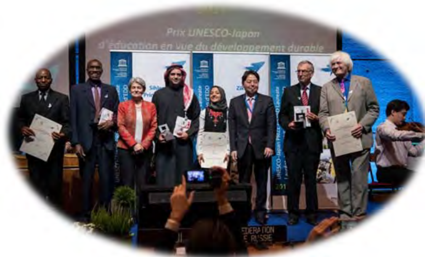
▲ 2017년도 유네스코-일본 ESD상 시상식