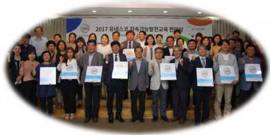
▲ ESD 공식프로젝트 인증서 수여식에 참석한 프로젝트 담당자들

유네스코한국위원회는 2011년부터 ‘유네스코 지속가능발전교육 공식프로젝트 인증제’(Korean UNESCO ESD Official Project, ESD 인증제)를 추진해 왔습니다. 「유네스코지속가능발전교육공식프로젝트인증제 운영규정」(운영규정)에 법적 기반을 두고 있는 ESD 인증제는 한국 사회에서 추진되고 있는 ‘지속가능한’ 교육 및 훈련 활동을 증진하고, 다양한 ‘한국형 ESD’ 실천사례를 발굴함으로써 이를 모범 사례로 국내외에 소개해 보급·확산하는 것을 목표로 하고 있습니다.