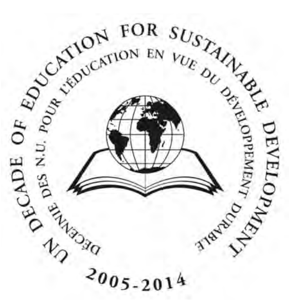
▲ ‘지속가능발전교육 10년’(DESD) 로고

오늘날 국제사회는 급격한 기후변화와 금융위기, 대량소비 확산, 인간안보 위협 등 복잡한 문제들에 직면해 있습니다. 이러한 전지구적 위기를 극복해 나가는 데 있어 현 세대와 미래 세대 모두를 위한 ‘지속가능발전’(sustainable development)의 중요성이 강조되고 있습니다.