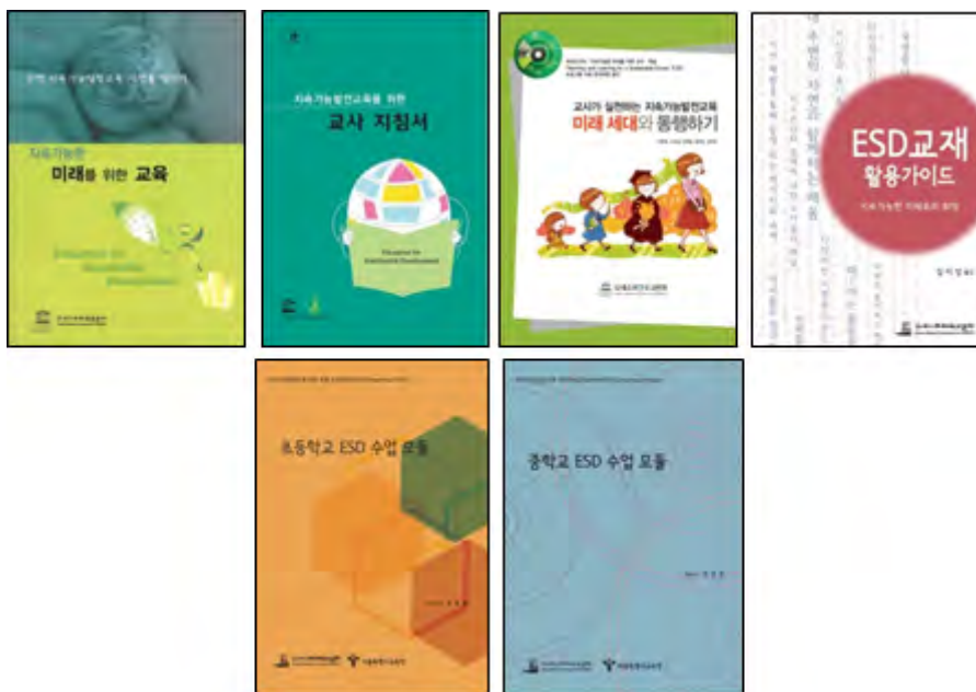
▲ ESD 교사지침서 및 수업모듈