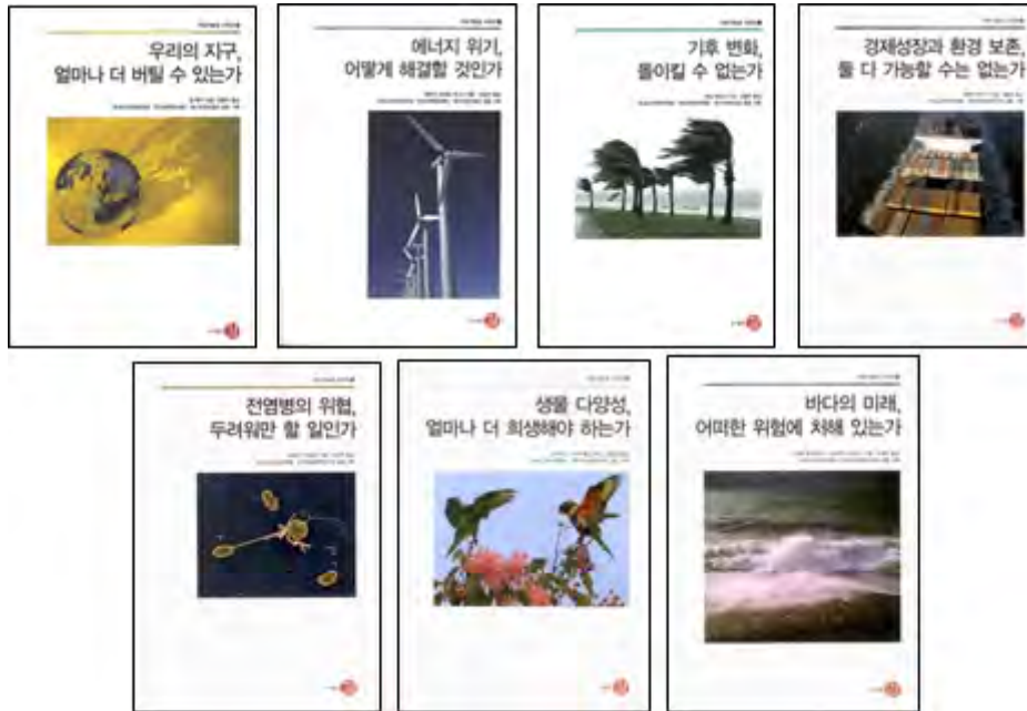
▲ 지속가능성 시리즈