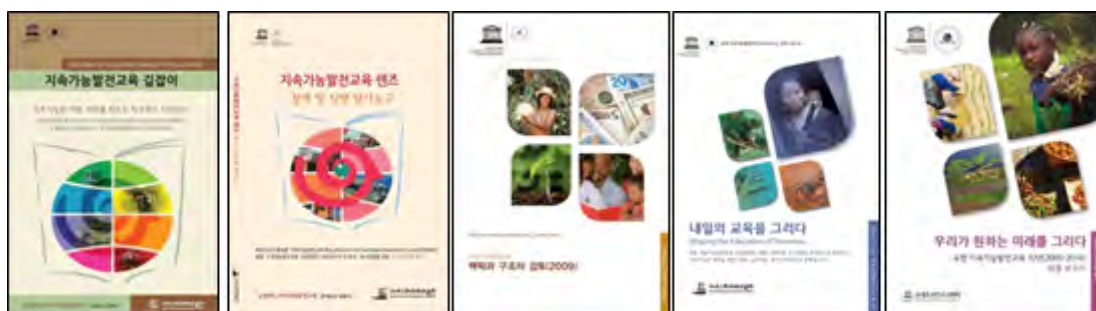
▲ 유네스코 본부 ESD 발간자료 국문판